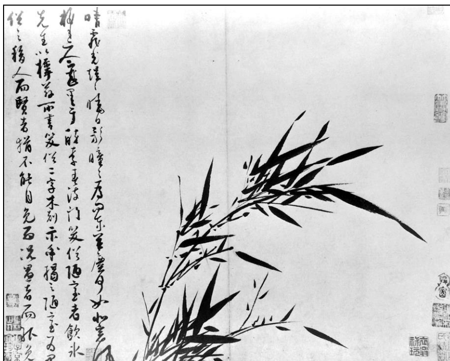
1. kép – „Bambuszerdő” (Klasszikus kínai tusfestmény)