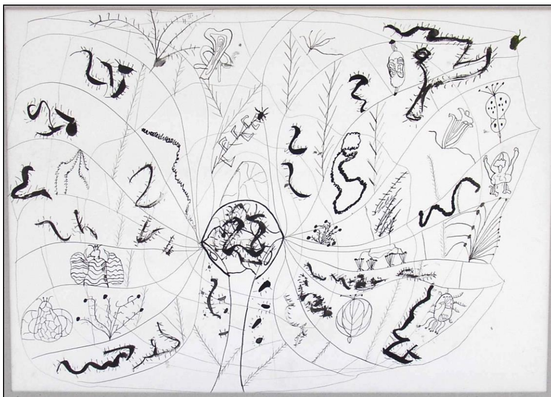
13. kép - 12 éves fiú rajza „Különös lény”

A 13. képhez 12 éves alkotója a következőket fűzte: Ez egy különös lény. Már nagyon régóta nem evett, már nagyon éhes volt. Egyszer az egyik este kifeszítette hálóját, és most szerencséje volt, rengeteg élőlény akadt bele. Ezeket sorra megette, azonban úgy teleette magát, hogy az erei szétpattantak a sok tápláléktól, és így a lény elvérzett, elpusztult (szabadon idézve). Ez is az állami gondozott lét egy sajátos lélektani szituációja. A táplálék utáni vágy, az éhség, érzelmi éhséget is kifejezhet. Egyrészt nagyon vágyik a szeretetre, elfogadó érzelmekre, ki van rá éhezve, másrészt ugyanakkor szorong is tőle, mivel ezzel kapcsolatban sok csalódás érte. Ösztönösen fél attól, hogy valakit majd megint megszeret, akit aztán rövidesen újból el is veszít. A normál családban élő gyermekek egy életen át ugyanazon szülőkhöz, nagyszülőkhöz kötődnek. Ezzel szemben az állami gondozott gyerekek sokat hányódnak, szülők, mostoha- és nevelőszülők, nevelőtanárok és patronálók között. Gyakran egész életükben más és más felnőttekhez kell kötödniük. A világban az emberek megállnak egy pillanatra, odadobnak nekik egy-egy szeretetmorzsát , megsajnálják őket, aztán mennek tovább a dolguk után. A gyerekek ezeket a szeretetmorzsákat is komolyan veszik, és így többnyire csalódnak. Ezek a traumák vezetnek ahhoz, hogy felnőtt korukban olyan nehezen tudnak tartós párkapcsolatokat kialakítani, családot alapítani.