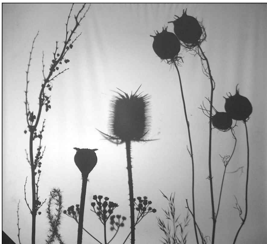
2. kép - Növényi formák árnyképe (írásvetítő segítségével)

A gyerekek, kamaszok tollal, ecsettel, fekete vagy színes tussal, diófapáccal, vagy színes ceruzával rajzolnak /3. kép/. Igen, színeket is lehet alkalmazni. Természetesen – mivel az árnyékok sötétek – bármilyen szín beleképzelhető a formákba /4. kép /.