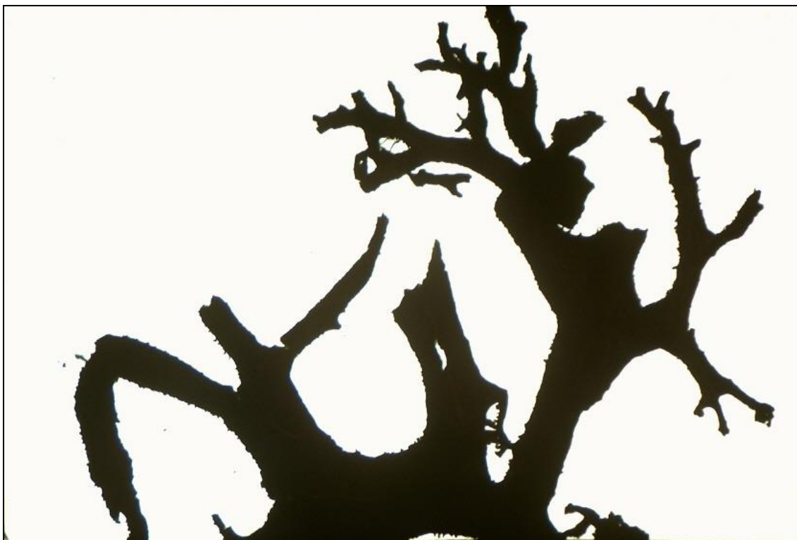
7. kép - Diakeretbe préselt zuzmó árnyképe