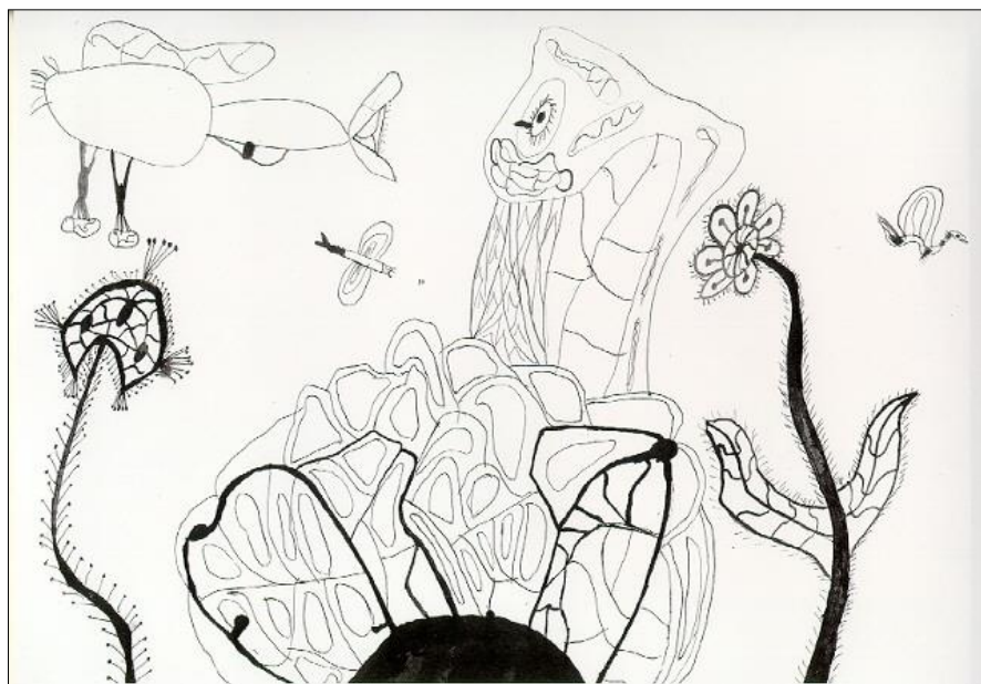
6. kép - „Sárkány fiú születik” 11 éves fiú tusrája