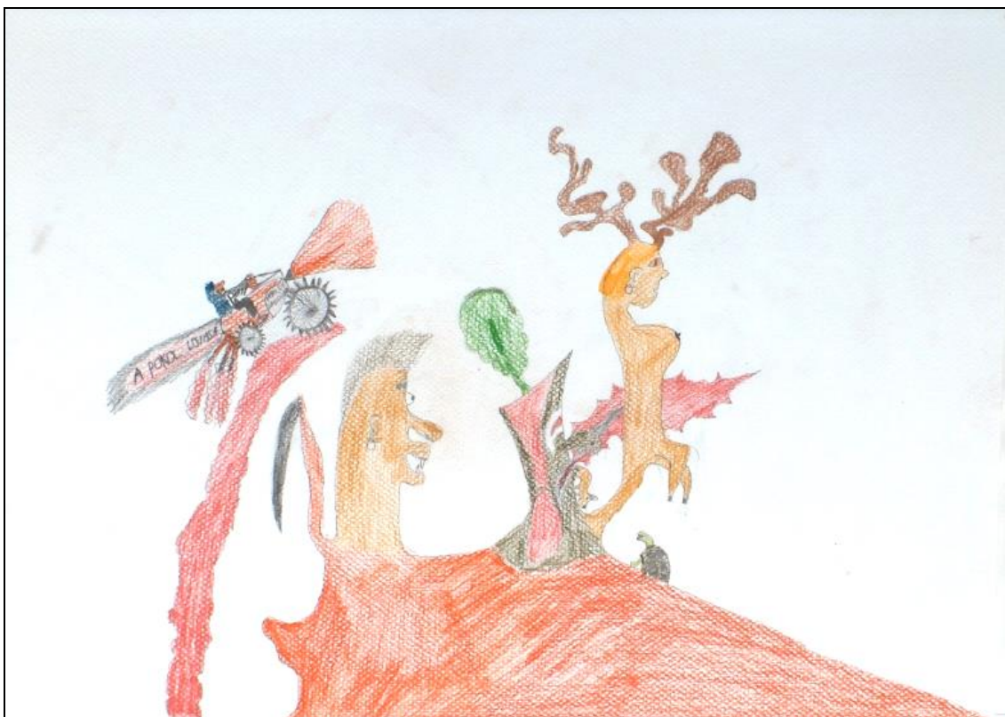
8. kép - 15 éves fiú szinesceruza rajza