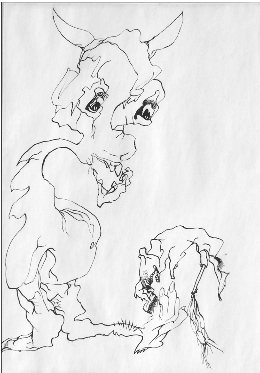
10. kép "Megaláztatás" 15 éves fiú rajza