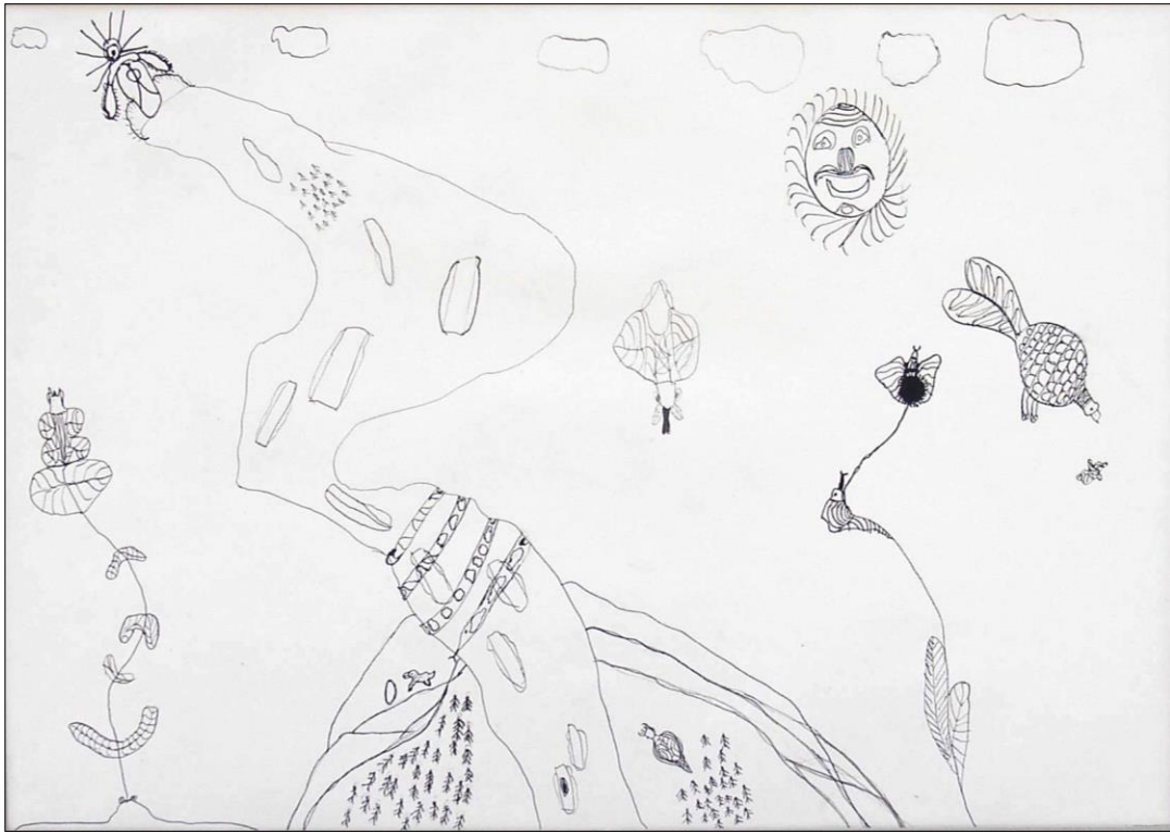
11. kép - 12 éves fiú "Életfa" című tusrajza

A rajzon az anyaméhet szimbolizáló kis dombból bújik elő az ember életútját jelképező életfa. Az életfa felfelé vezet, a felhők közé, a sugárzó nap birodalmába. Az életfa útján csoportosan kis hangyaszerű lények igyekeznek felfelé az égbe.