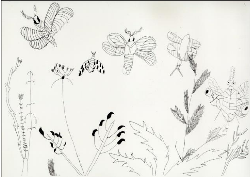
3. kép – „Árnyék tanulmány” 8 éves fiú tusrajza

E módszerrel a gyermekek mind a formaképzésben, mind a színhasználatban megszabadulnak gátlásaiktól, és felszabadultan, saját egyéniségüket, eredeti ízüket beleviszik a rajzba. A rajzlapon a formát körülvevő teret üresen – illetve itt a rajzlapot fehérén – hagyják, akárcsak a kínai művészek. Így a fehér alap, mint tér – puritán módon – képalkotó elemmé válik, esztétikai értékekkel töltődik fel. Mint egy ablakon át, úgy tekintünk be valahová, ahol különös, titokzatos dolgok várnak ránk, melyek egyelőre még elvesznek a háttér sejtelmes fehérjében. Ez a kifejezőmód jobban megmozgatja a bennünk rejlő tudattalan világot, mint a „szájbarágós”, elsősorban a racionális énünket megmozgatni akaró európai ábrázolás, amely a háttérrel pontosan előírja, ábrázolja számunkra. Ebben a típusú ábrázolási módban tehát a megjelenő formák egyidejűleg automatikusan létrehozzák maguk körül a teret, és jelentéssel ruházzák fel azt.