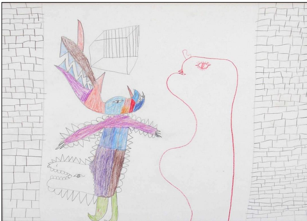
12. kép - 13 éves fiú rajza „Börtön falai között”

A gyermekotthon épülete nem börtön, az intézet nyitott, a gyermekek kijárhatnak belőle, és ráadásul nincs is belső iskolája, a növendékek a környék iskoláiba járnak. Mégis: lelki értelemben zárt, sajátos világ. Megpróbálja ugyan a valóságos életet, a családot utánozni, mégis szükségszerűen az egészséges, a való élettől idegen helyzetben léteznek benne a gyermekek. Ezt a sajátos állapotot fejezi ki a 13 éves fiúgyermek rajza /12. kép/, melynek alkotója a „Börtön falai között” címet adta. E zárt világban való létezésnek kétféle lelki reakcióját láthatjuk a képen, meggyőző kifejezőerővel ábrázolva. A férfitermészetű oldalon (ránézésre bal oldal) a zárt világban való szorongás agresszióban tör felszínre. Az agressziót kitért szájában lévő fogak illetve az alakok körüli fogazás erőteljes hangsúlyozása idézi meg. A másik, női természetű oldalon (ránézésre jobb oldal) az elfojtott szorongás másik típusú lelki reakcióját láthatjuk, a tehetetlenség érzését, a passzivitásba vonulás attitűdjét. Ezt a kéz nélküli, „Barbamama”-típusú alakformálás fejezi ki meggyőzően számunkra. Érdekes az is, hogy ez a nőies alak szellem természetű. A fiú édesanyja korán elhunyt.