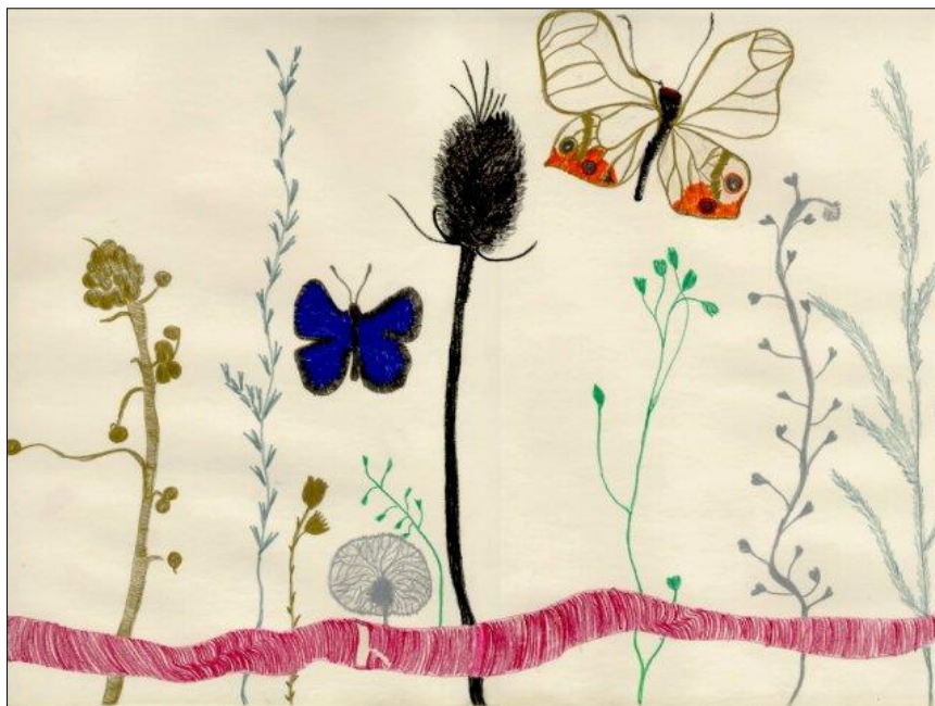
4. kép – „Árnyék tanulmány” 14 éves leány színesceruza rajza

E módszerrel a gyermekek mind a formaképzésben, mind a színhasználatban megszabadulnak gátlásaiktól, és felszabadultan, saját egyéniségüket, eredeti ízüket beleviszik a rajzba. A rajzlapon a formát körülvevő teret üresen – illetve itt a rajzlapot fehérén – hagyják, akárcsak a kínai művészek. Így a fehér alap, mint tér – puritán módon – képalkotó elemmé válik, esztétikai értékekkel töltődik fel. Mint egy ablakon át, úgy tekintünk be valahová, ahol különös, titokzatos dolgok várnak ránk, melyek egyelőre még elvesznek a háttér sejtelmes fehérjében. Ez a kifejezőmód jobban megmozgatja a bennünk rejlő tudattalan világot, mint a „szájbarágós”, elsősorban a racionális énünket megmozgatni akaró európai ábrázolás, amely a háttérrel pontosan előírja, ábrázolja számunkra. Ebben a típusú ábrázolási módban tehát a megjelenő formák egyidejűleg automatikusan létrehozzák maguk körül a teret, és jelentéssel ruházzák fel azt.