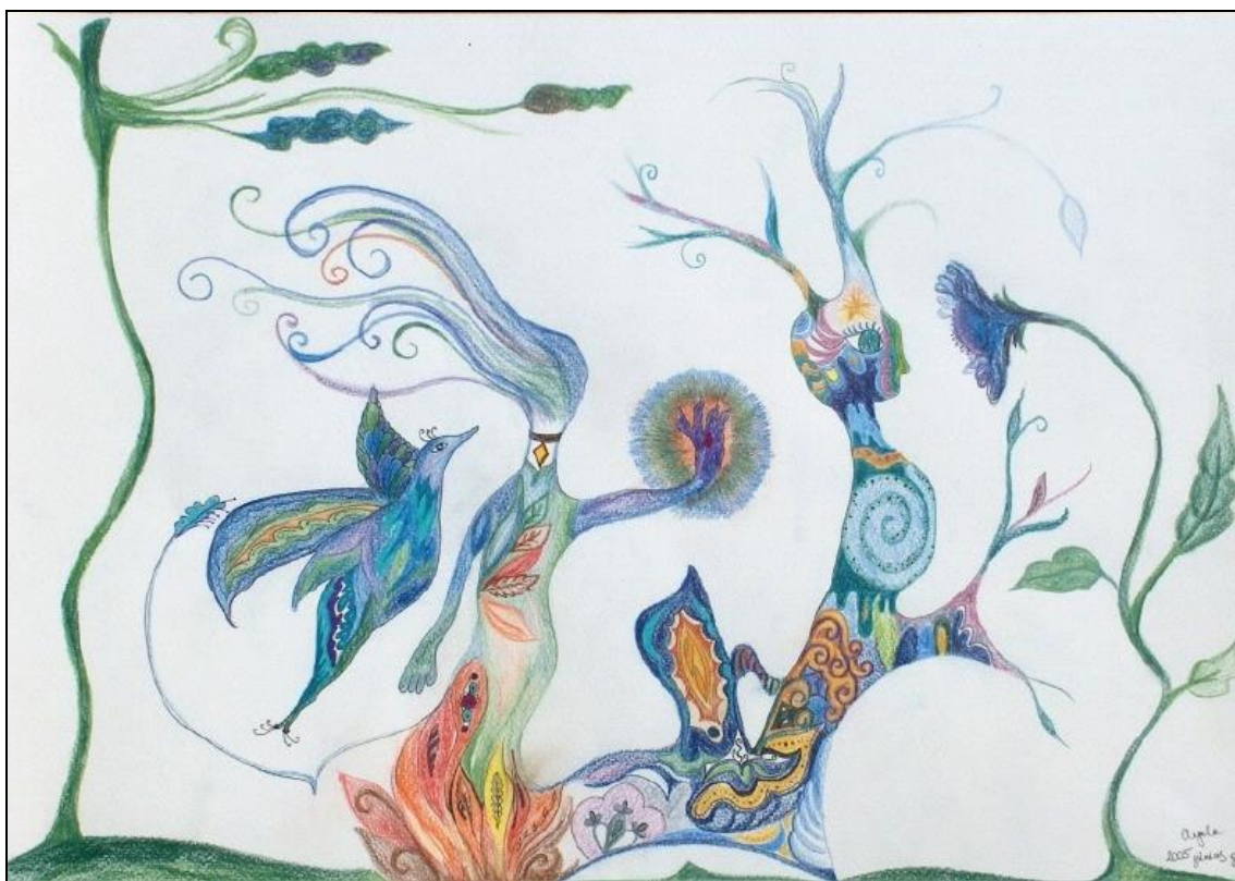
9. kép - 21 éves leány színes ceruza rajza

Megjegyzem, hogy a Rorschach-teszt is hasonló elvekre épül. Itt lényegében a gondolkodás, illetve a képzelet analógiás műveletéről van szó. Az egyszerre több jelentést is hordozó árnykép valamit felidéz a tudatban, valami eszünkbe jut róla, a hasonlóság elve alapján. Ez a felismerés a tudattalanból is hívhat elő lelki tartalmakat.